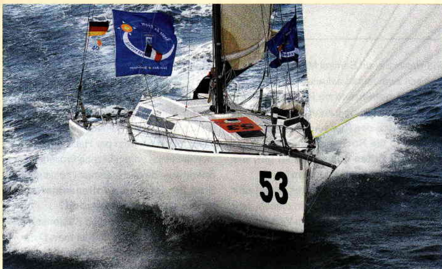
Die Class 40 „Tzu Hang“ vom Typ Akilaria ist ein Marc-Lombard-Design von 2007