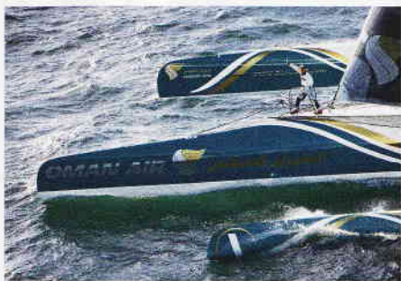
Der neue Tri „Oman Air“ zerbrach, Skipper Gavignet wurde unverletzt geborgen